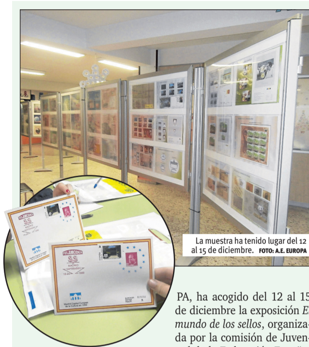
La muestra ha tenido lugar del 12 al 15 de diciembre.

La plataforma presentaba el 22 de diciembre un escrito a la CAM en este sentido, y ha solicitado reuniones a todos los grupos parlamentarios de la Asamblea de Madrid