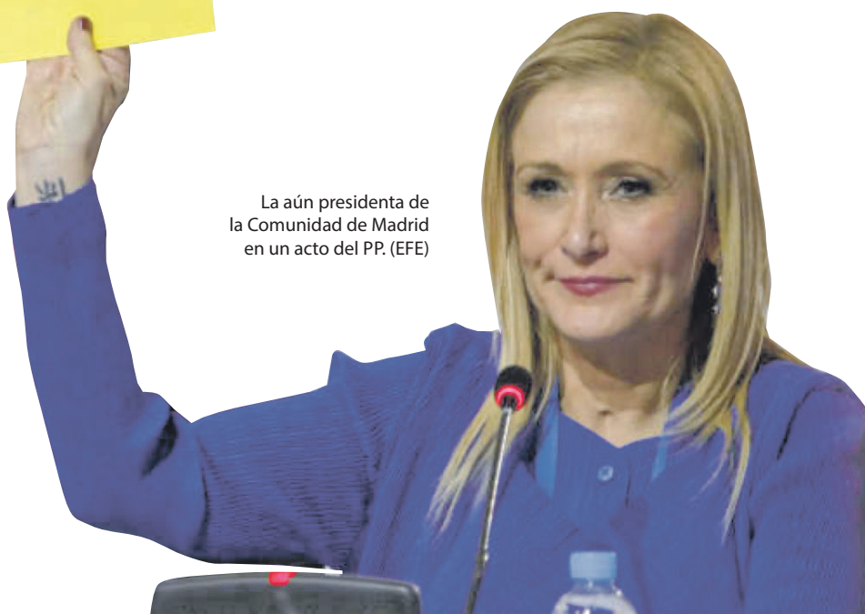
La aún presidenta de la Comunidad de Madrid en un acto del PP.